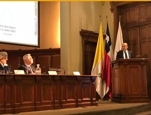
Contralor General de la República, Jorge Bermúdez.